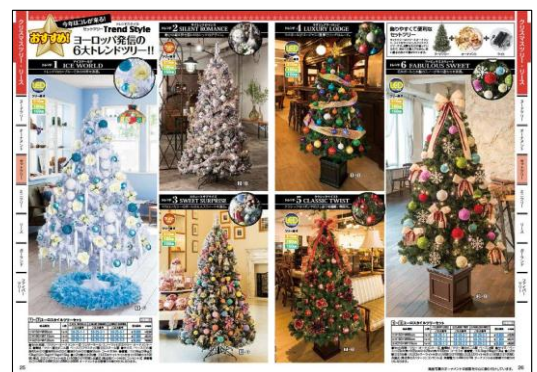
▲ヨーロッパ発信の6大トレンドツリー